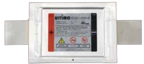
ラミネート形セル